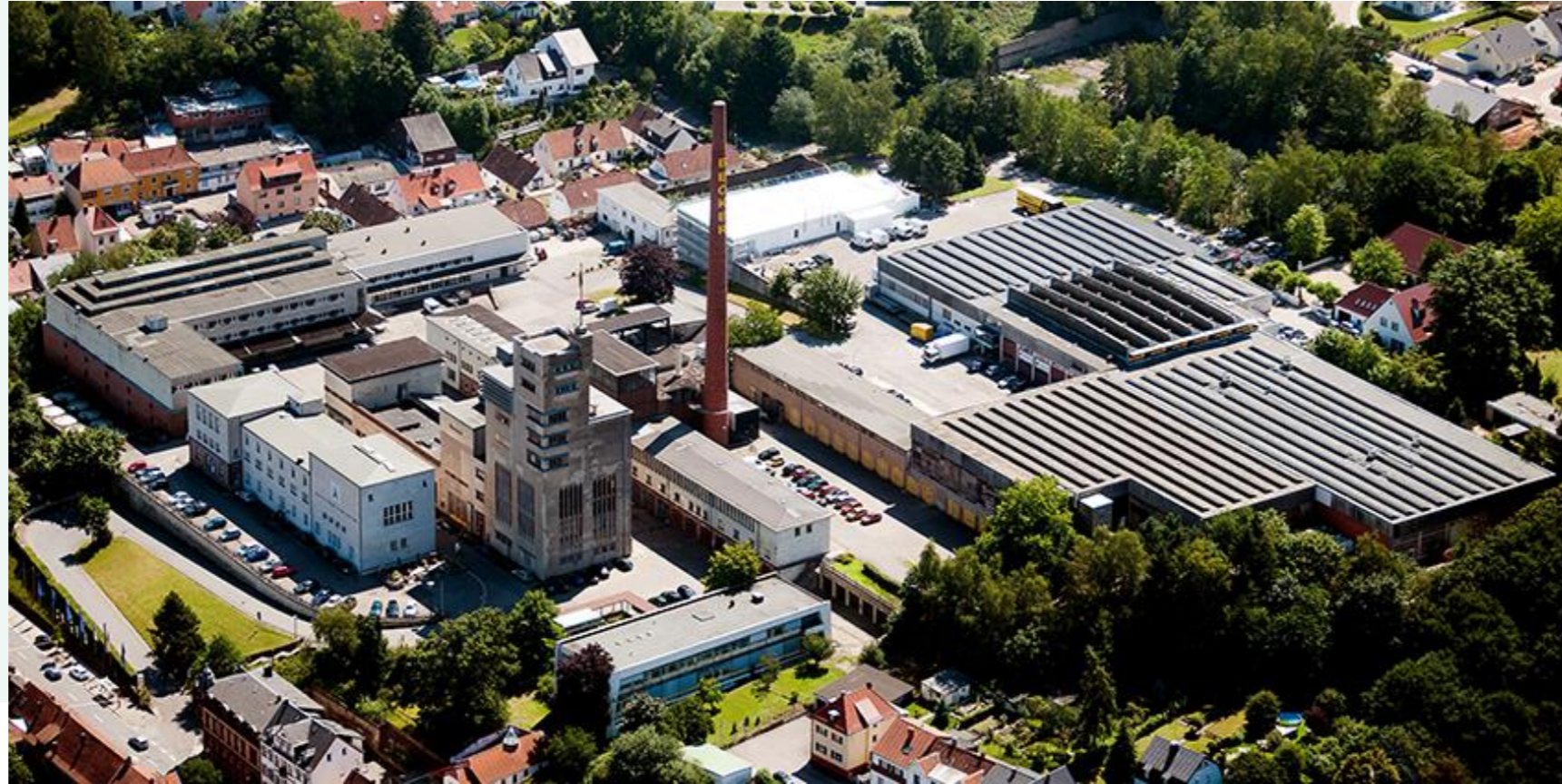
Innovationspark am Beckerturm, St. Ingbert